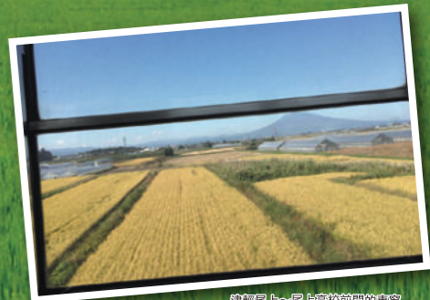
津輕尾上~尾上高校前間的車窗 (岩木山與稻田 9月)

「稻田鐵路」是弘南鐵道弘南線的愛稱。 因為列車行駛在以青森縣最高峰「岩木山」為背景的稻田中。 春天，青山倒映於水田之中；秋天，金黃的稻穗搖曳風中…… 質樸的風景，暖人心田。該線路1927年開通，全長16.8公里， 乘車時間約35分鐘。 將弘前市和平川市、田舍館村、黑石市悠然地連接起來。