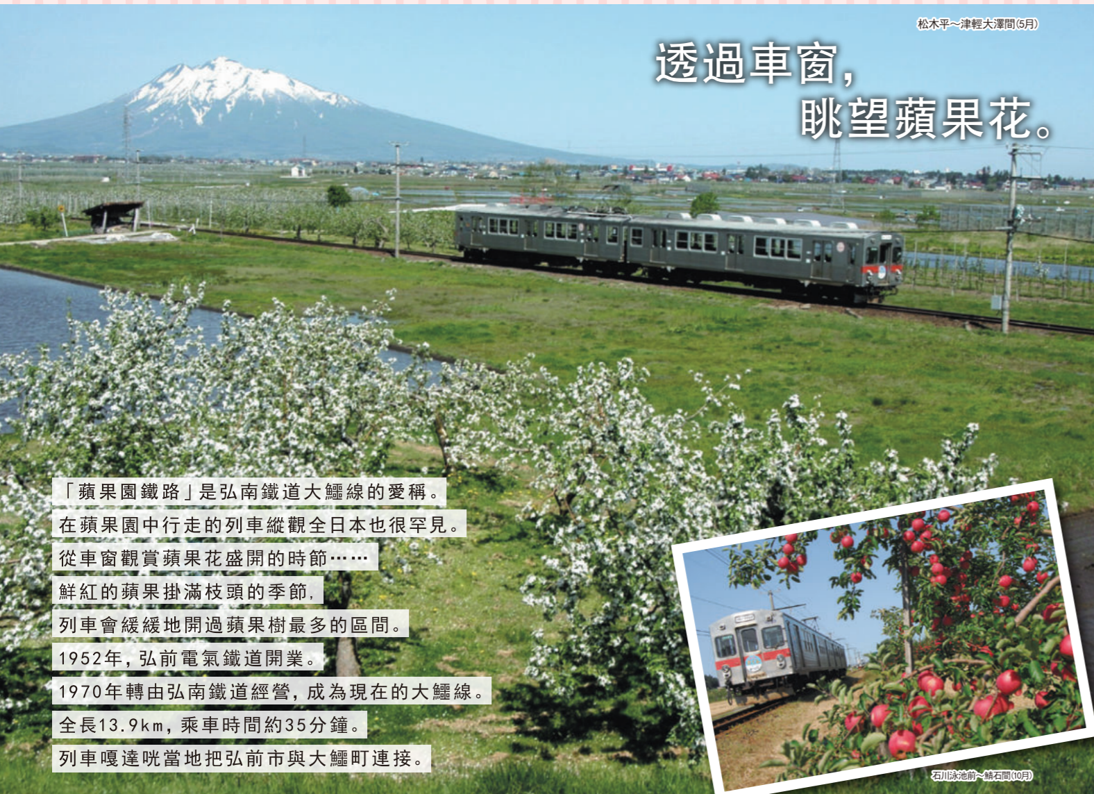
松木平~津輕大澤間(5月)