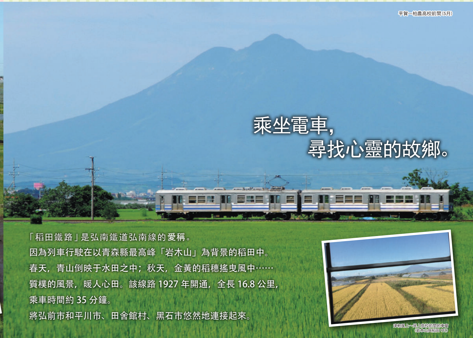
平賀~柏農高校前間(5月)