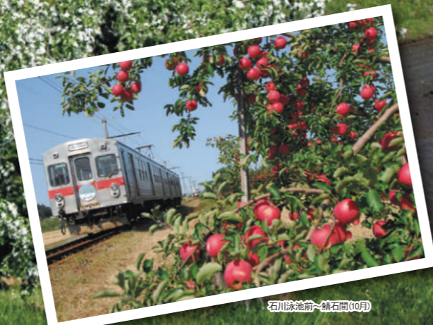
石川跡池前~鱒石間(10月)