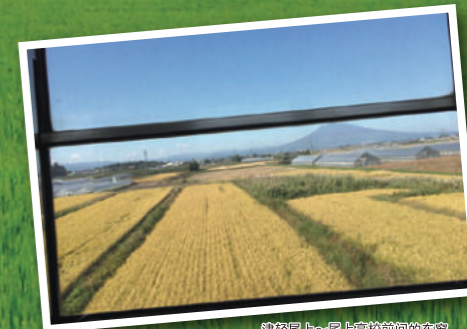
前轻尾上~尾上高校前间的车窗 (岩木山与稻田 9月)