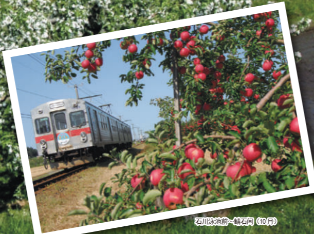
石川泳池前~幡石间 (10月)