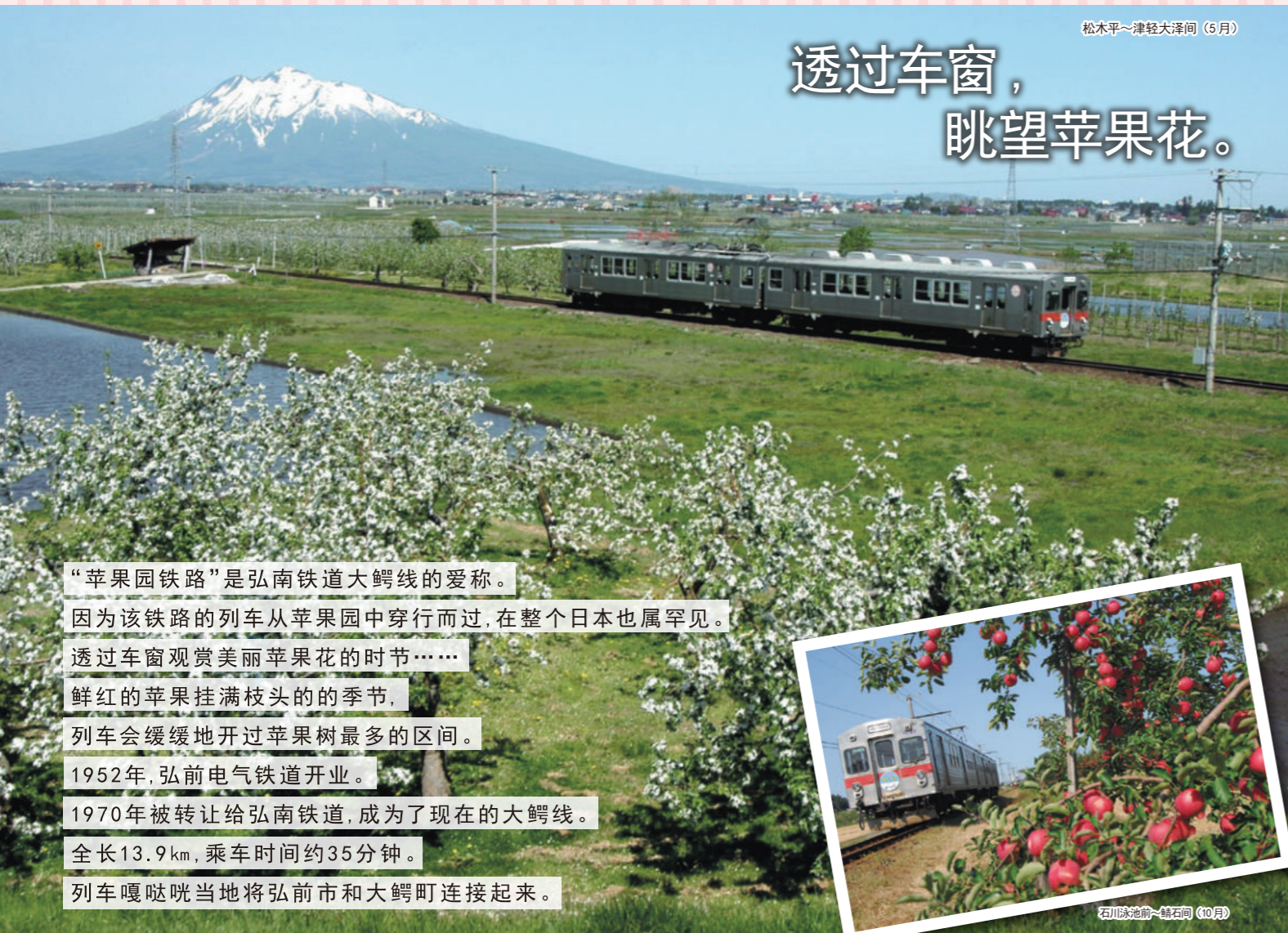
松木平~津轻大泽间 (5月)