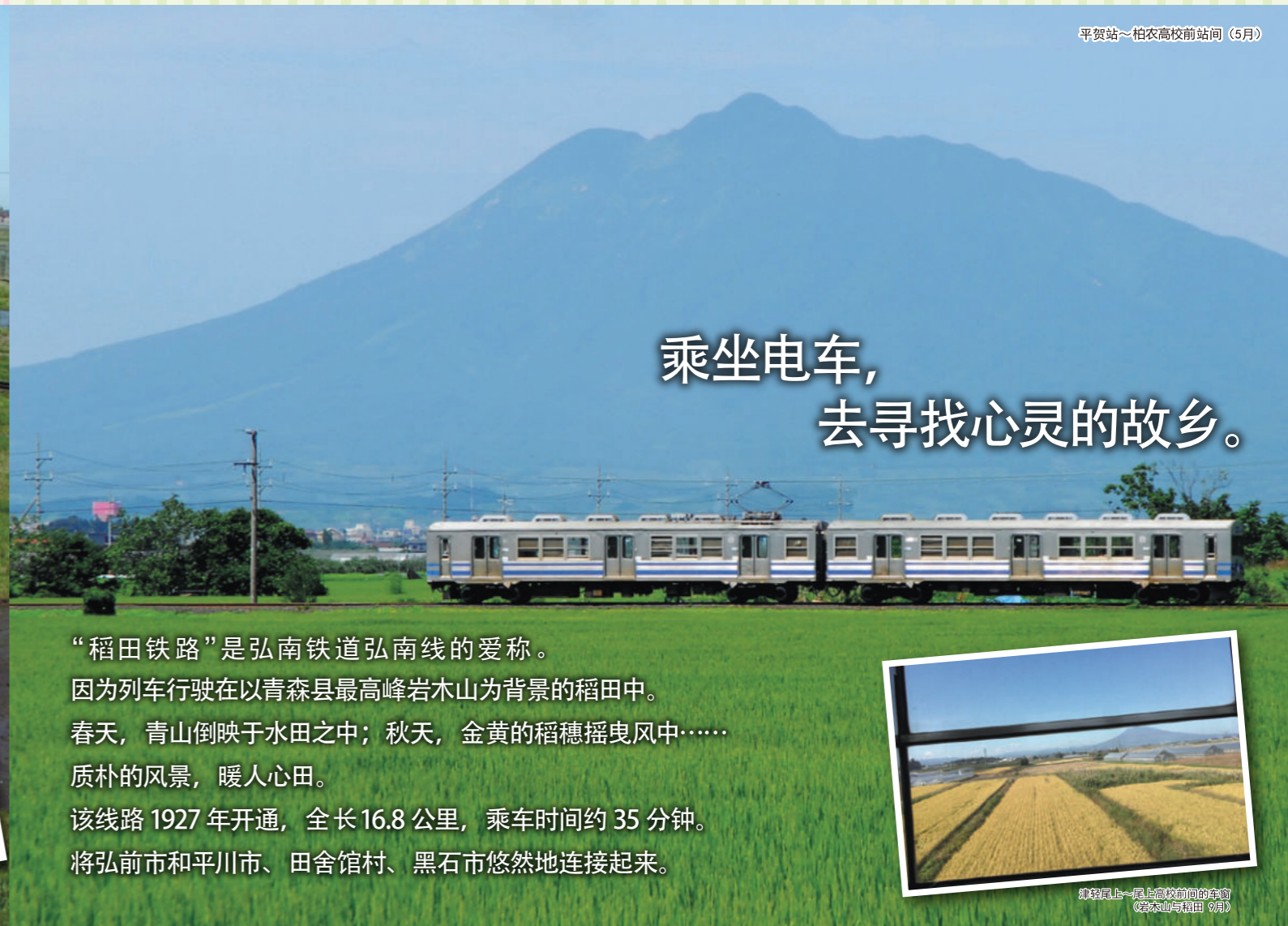
平贺站~柏农高校前站间 (5月)