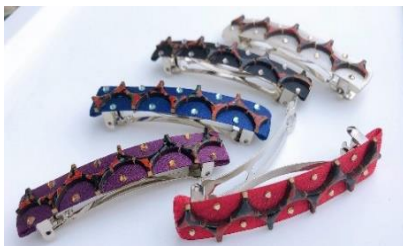
津軽塗り アクセサリ