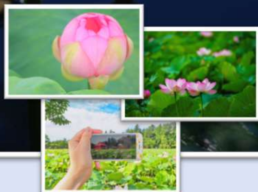
※写真は昨年の入賞作品です。